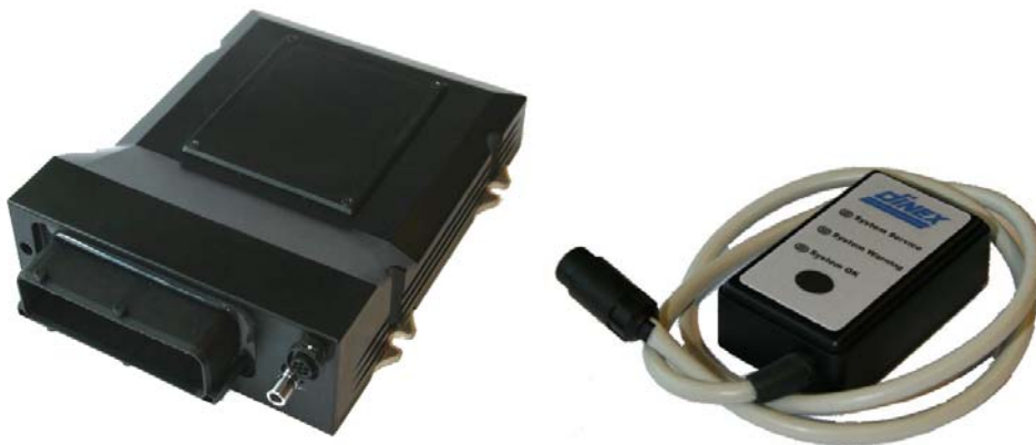
Figur 2, DiNLOG datalogger og alarm display

DiNLOG filterovervågningssystemet er designet til at overvåge filtrets tilstand samt give alarm hvis filtret skal renses og ved registrering af fejltilstande. Alle alarmer registreres i DiNLOG'ens datalog og kommunikerer til chaufføren/service teknikeren via det medfølgende alarm display.